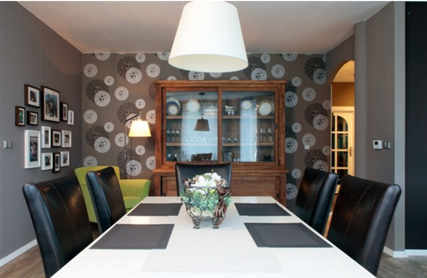
Nad jídelním stolem použila designérka svítidlo Tolomeo od Artemide.

Byla to pohroma. Prasklé střešní okno a dešťová průtrž dokázaly vytopit přízemní část domu tak, že zůstalo jediné řešení: vše předělat. Dnes jsou majitelé rádi, několik let odkládaná proměna přišla právě včas.